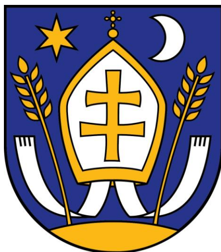
Erb obce Močenok