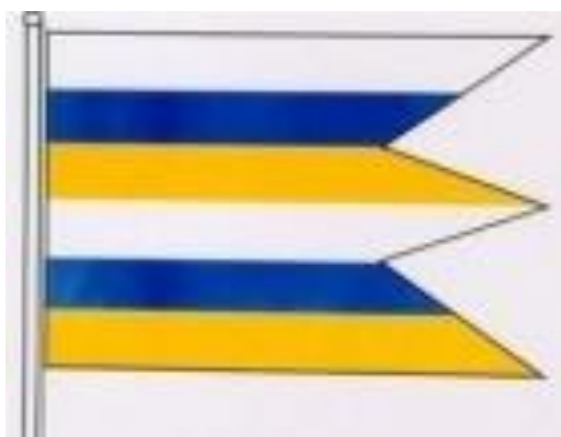
Zástava obce Močenok