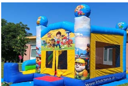
kombo Paw Patrol